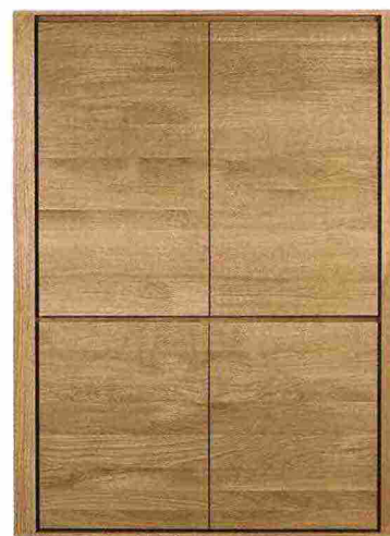
4 SENZA PIEDI? C'È PIÙ SPAZIO ALL'INTERNO

(www.caccaro.com) è ottenuto dall'unione del terminale con ripiani a vista con il modulo ad apertura push pull. In laccato opaco, misura L 127,5 x P 42,7 x H 263,6 cm; costa 2.323 euro + Iva.