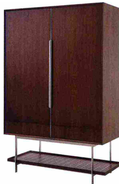
3 LA BASE PUÒ ESSERE USATA PER LE CALZATURE