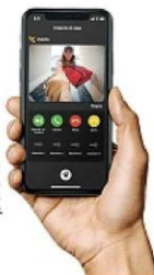
Il sistema di videofonia connessa di Vimar.