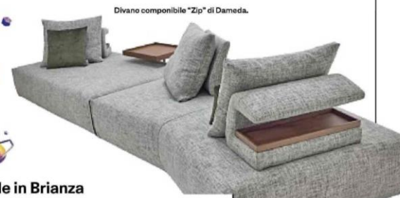
Divano componibile "Zip" di Damedà.