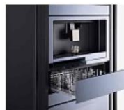
Sopra e in alto, un "Hospitality Office" di V-ZUG e Frigo2000.

Nati dalla collaborazione tra il brand svizzero V-ZUG e Frigo2000 Collection, gli "Hospitality Office" sono mobiliti minimali e versatili da attrezzare con macchine da caffè d'alta gamma, cassetti scaldatavvaine, forno microonde a vapore e altri elettrodomestici di ultima generazione. Per creare in ufficio un angolo bar (e pranzo) di gran classe. INFO: FRIGO2000.IT