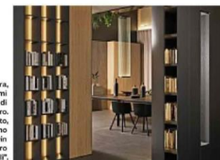
A destra, sistemi divisori di Caccaro. Sotto, cuscino "BTwin" by Piero Gemelli.

Per dormire bene serve il supporto giusto e i nuovi materassi DaunenStep combinano memory foam e molle insacchettate per dare sostegno (e sollievo) ai muscoli posturali. Tre le linee - "Classic", "Premium" e "Deluxe" - tutte con rivestimento sfoderabile e lavabile per tenere lontani allergeni e batteri. Oltre che in negozio, si possono acquistare online. La consegna "Guantri Bianchi+Smaltimento" garantisce il ritiro del vecchio materasso. INFO: DAUNENSTEP.COM