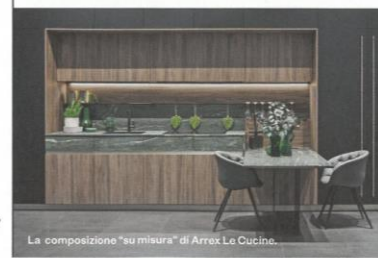
La composizione "su misura" di Arrex Le Cucine.