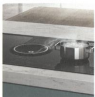
Il piano "Nikola Tesla One HP".

Minimale ma ipertecnologico, il piano a induzione con aspirazione integrata "Nikola Tesla One HP" di Elica ha funzioni cottura avanzate e aspiratore che elimina i fumi sul nascere. Il tutto nel segno del design, premiato da un Compasso d'Oro. INFO: ELICA.COM