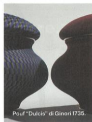
Pouf "Dulcis" di Ginori 1735.