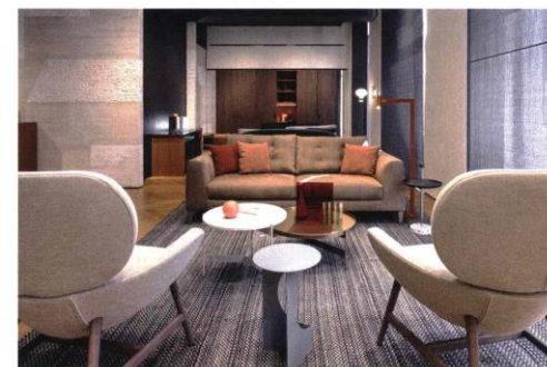
SOPRA: LO SPAZIO PIANCA & PARTNERS IN VIA DI PORTA TENAGLIA A MILANO RACCOLLE LA RETE DI 27 BRAND MADE IN ITALY DI CUI PIANCA È IL CAPOFILA. SOTTO: IL CONCEPT STORE MO 1950 IN VIA CARDUCCI A MILANO OFFRE SOLUZIONI PERSONALIZZATE GRAZIE ALL'OFFERTA DI OLIVIERI & FRAG E CON IL CONTRIBUTO TECNICO DI CARPET EDITION

di cantiere, per case "ready to live" al rogito o, se in affitto, immediatamente alla fine dei lavori. Ampie aree dedicate al contract sono sempre più frequenti anche all'interno di flagship store monomarca.