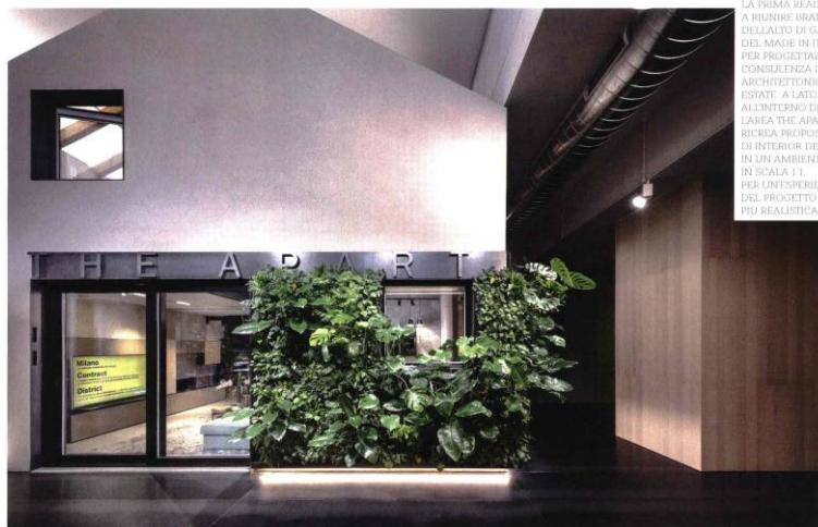
IN BASSO: L'ESTERNO DI MILANO CONTRACT DISTRICT (MCD) IN VIA SUCCHERBENI A MILANO. LA PRIMA REALTA' A RIUNIRE BRAND DELLA GAMMA DEL MADE IN ITALY PER PROGETTAZIONE E CONSULENZA IN AMBITO ARCHITETTONICO E REAL ESTATE. A LATO: ALL'INTERNO DI MCD, L'AREA THE APARTMENT RICREA PROPOSTE DI INTERIOR DESIGN IN UN AMBIENTE IN SCALA 1:1 PER UN'ESPERIENZA DEL PROGETTO PIU' REALISTICA